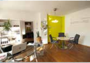
Brans & Dinkel, Hilfe für psychisch Kranke e.V. Schulstr. 6 66849 Landstuhl Tel.: 06371/92268