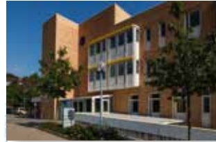
Pfalzkllinikum - Klinik für Psychiatrie, Psychosomatik und Psychotherapie Albert-Schweitzer-Str. 64 67655 Kaiserslautern Tel.: 0631/53490