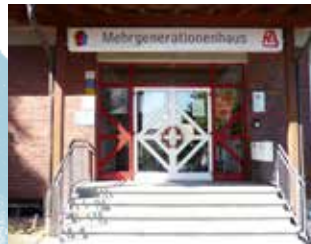
Kontakt- u. Beratungsstelle „Querbeet“ Landstuhler Str. 8A 66877 Ramstein (Mehrgenerationenhaus) Tel.: 06371/5980838