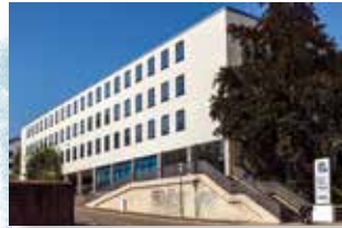
Kreisverwaltung Kaiserslautern Gesundheitsamt Pfaffstr. 40 67655 Kaiserslautern Tel.: 0631/7105520

Das Angebot der ambulanten psychosozialen Hilfen (ApsH) richtet sich an Menschen mit psychischen, körperlichen und/oder sozialen Beeinträchtigungen. Für Betroffene, die möglichst selbstständig leben wollen, aber dennoch Hilfe und Begleitung benötigen, besteht hier die Möglichkeit ambulanter Unterstützung zur Bewältigung Ihres Alltags. Erklärtes Ziel der ApsH ist die Integration der beeinträchtigten Menschen in die Gesellschaft. Weiterhin soll gemeinsam mit den Menschen durch ein gezieltes Hilfesystem ein selbstbestimmteres und eigenverantwortlicheres Leben ermöglicht werden.