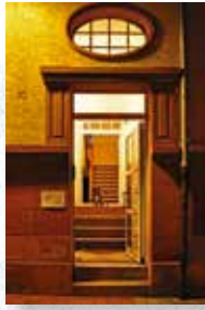
APU-Wiegerling Pirmasener Str. 92 67655 Kaiserslautern Tel.: 0631/6257912