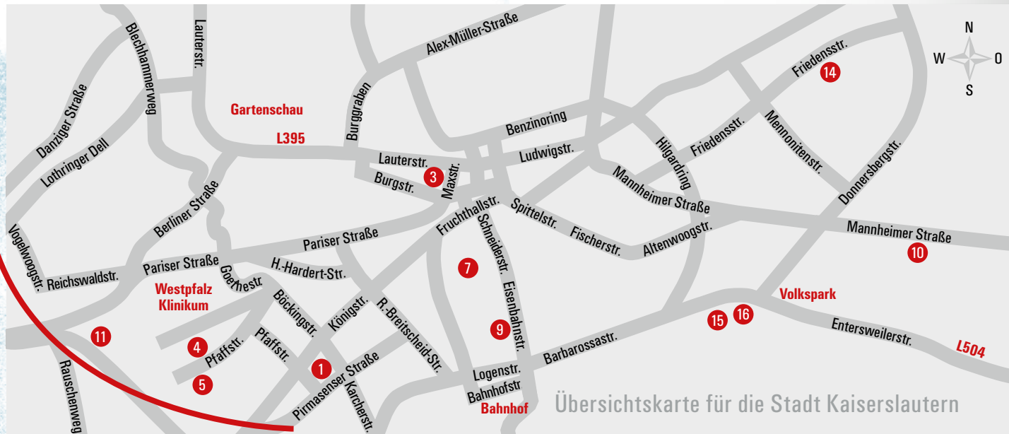
Übersichtskarte für die Stadt Kaiserslautern