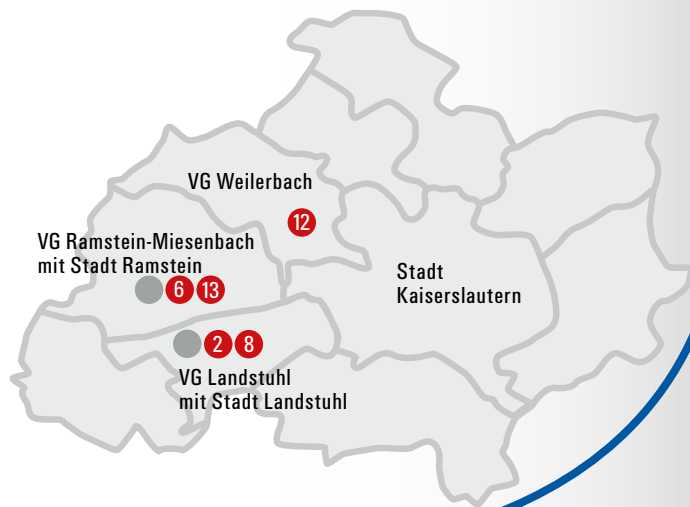
Übersichtskarte für den Kreis Kaiserslautern